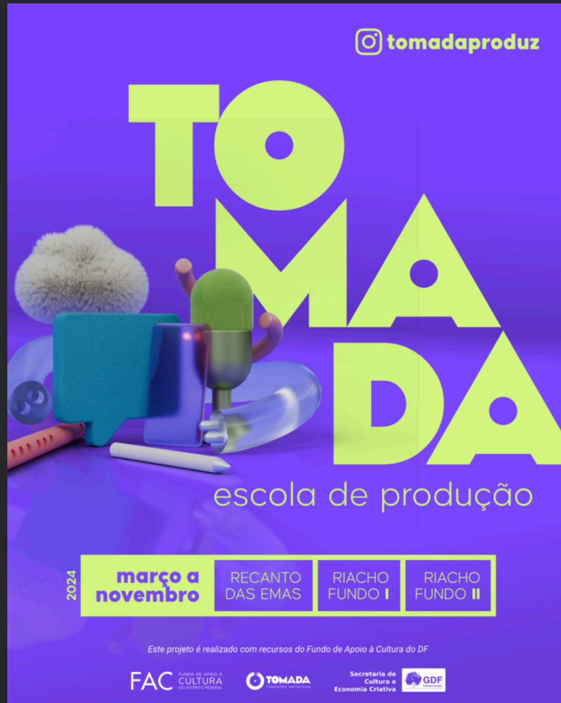
(2024) Concepção Oficinas de Arte-Educação e gestão.