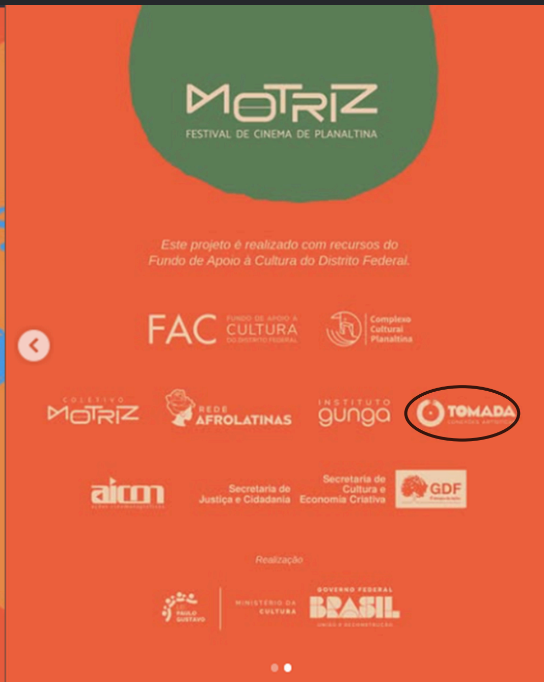
(2024) Função: Produção Execurtiva