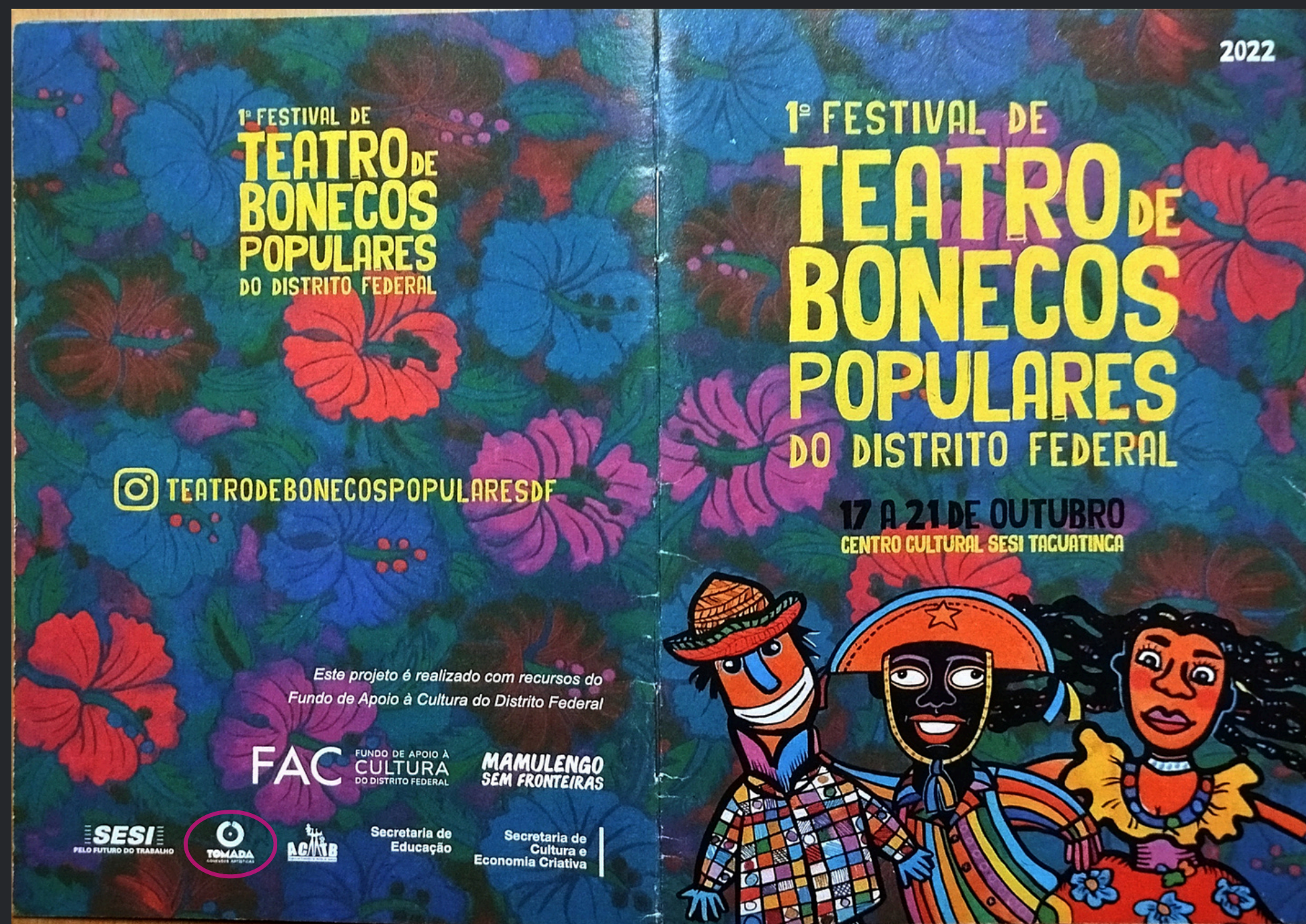
(2022) Função: Produção Executiva.