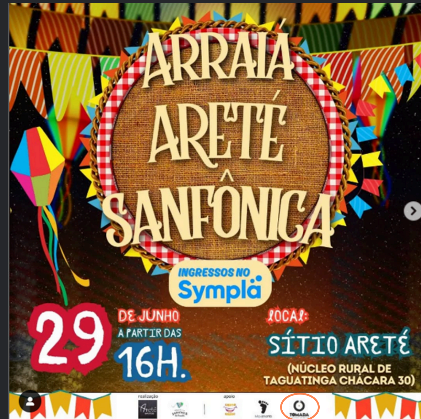
(2024) Função: Produção e apresentação