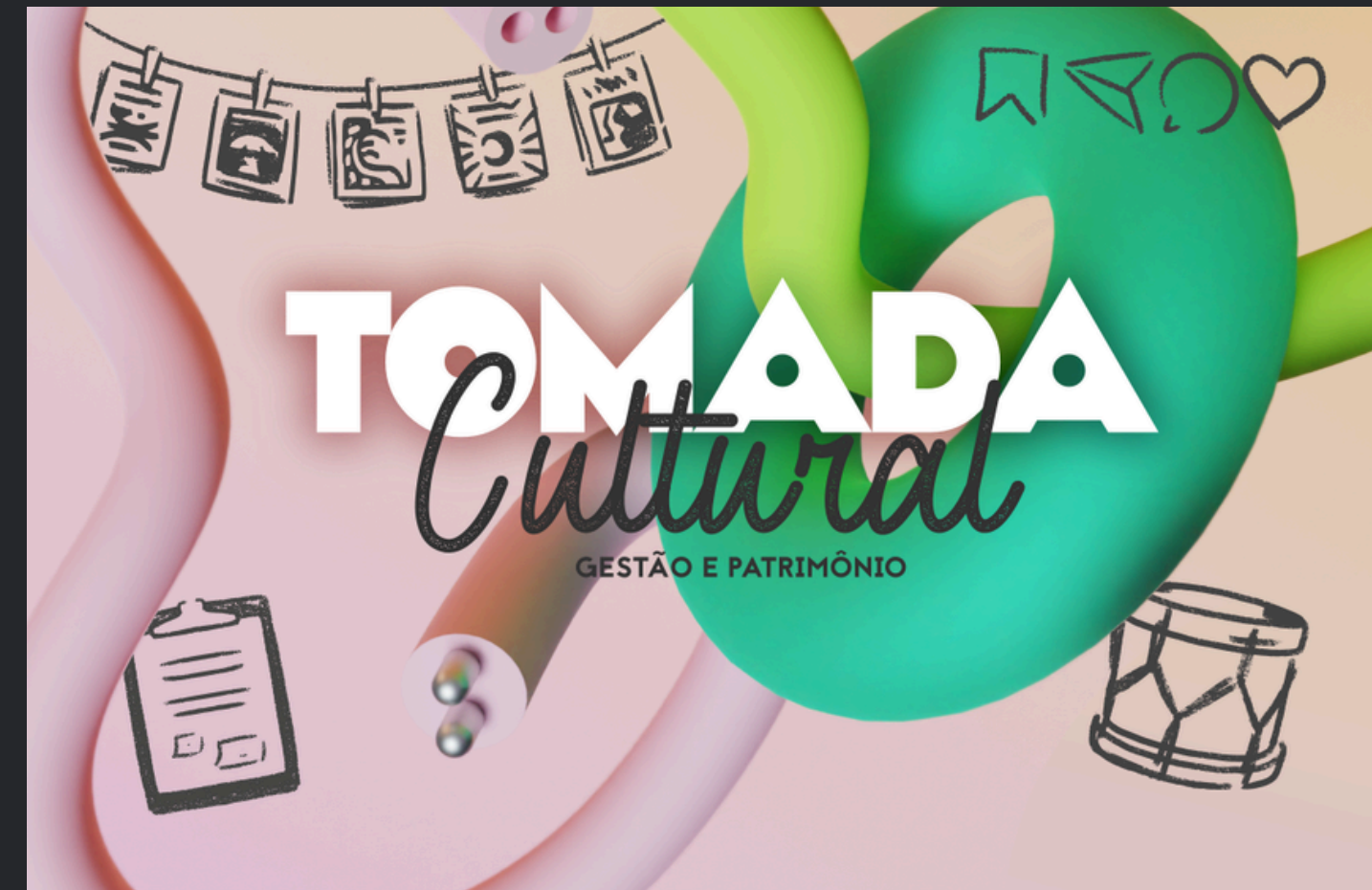
(2022) Função: Concepção; Coordenação, Produção Executiva;