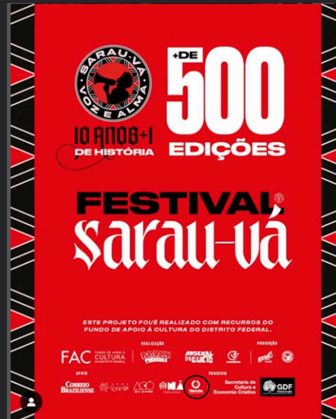
(2024) Função: Produção expográfica