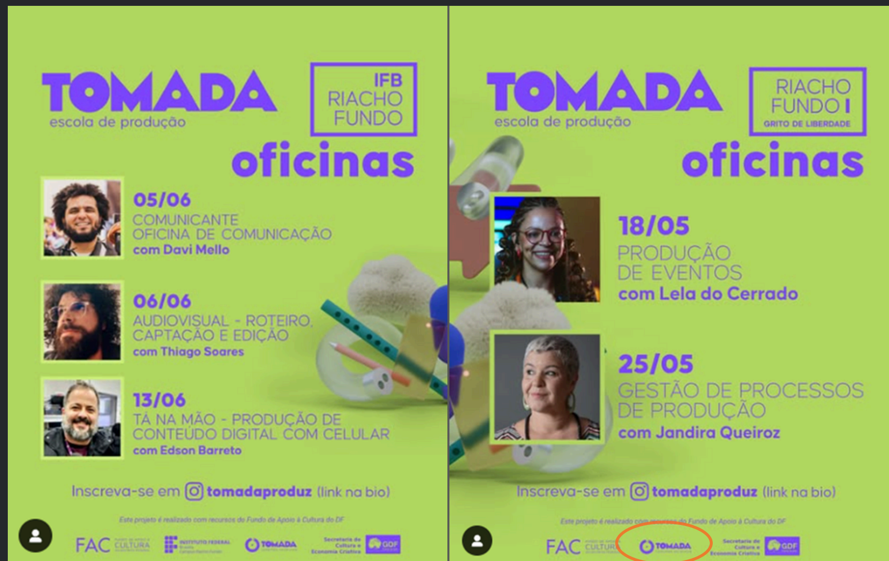
(2024) Função: Direção Geral e oficineira