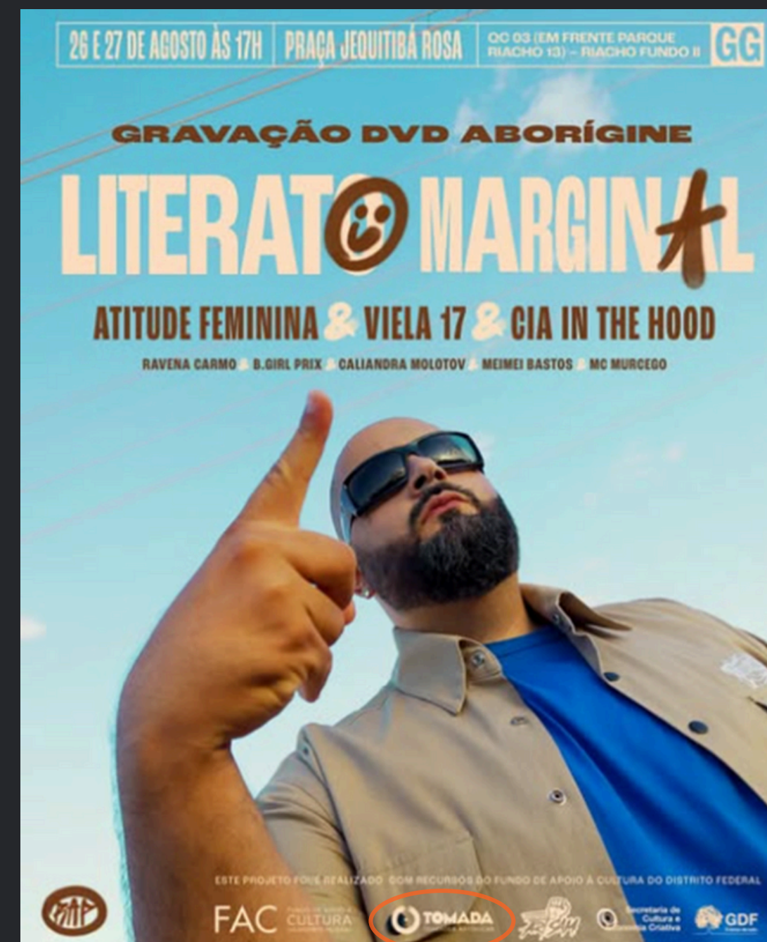
(2024) Função: Direção de Produção