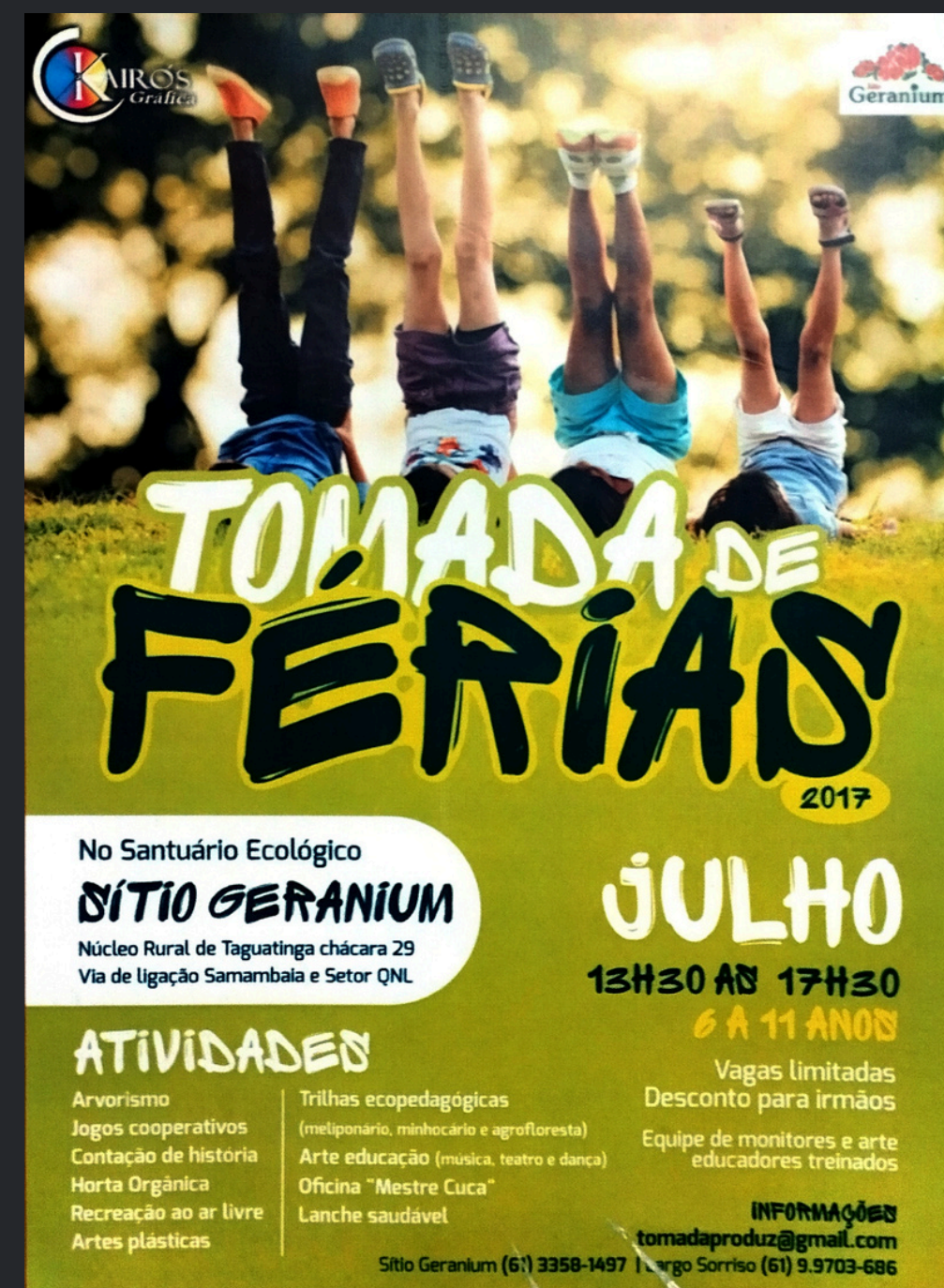
(2017) Função: Concepção; Coordenação; Arte-educação.