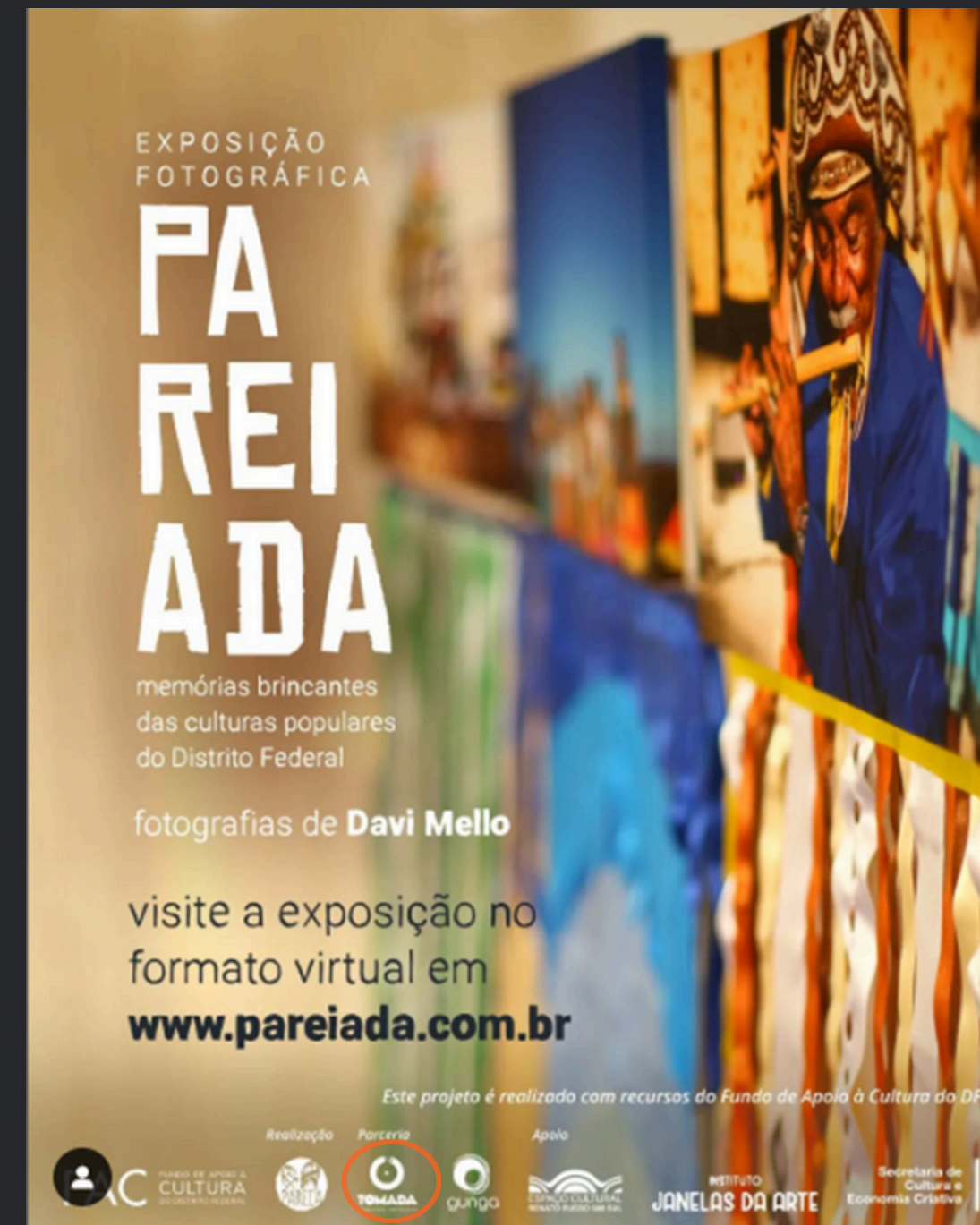
(2024) Função: Direção de produção